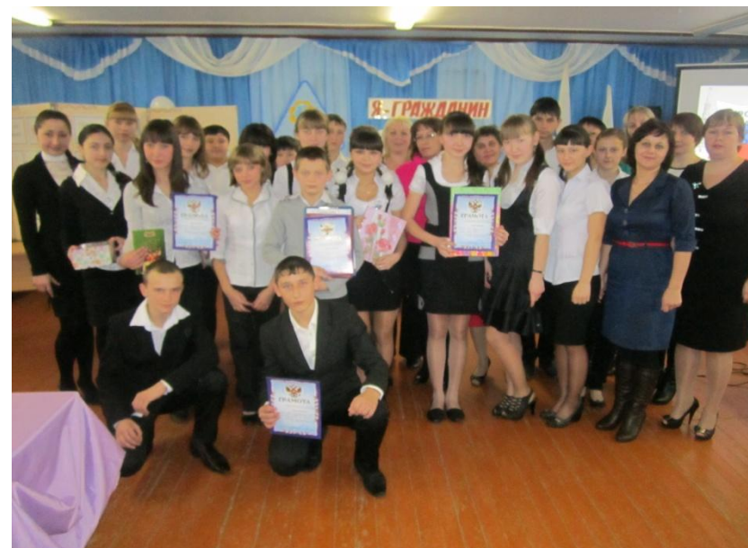
Районный этап Всероссийской акции «Я – гражданин России»

Поэтапный календарный план – это подробное описание всех видов деятельности и мероприятий с указанием сроков. При разработке этого раздела следует обратить внимание на следующие моменты: