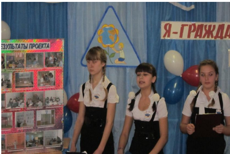
Районный этап Всероссийской акции «Я – гражданин России»